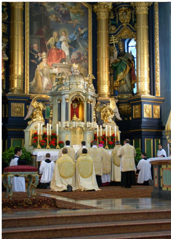
Blick in die Basilika beim Pontifikalamt

Am Samstag um 16.30 Uhr für beide Gruppen feierlicher Einzug und Teilnahme am Pontifikalamt.